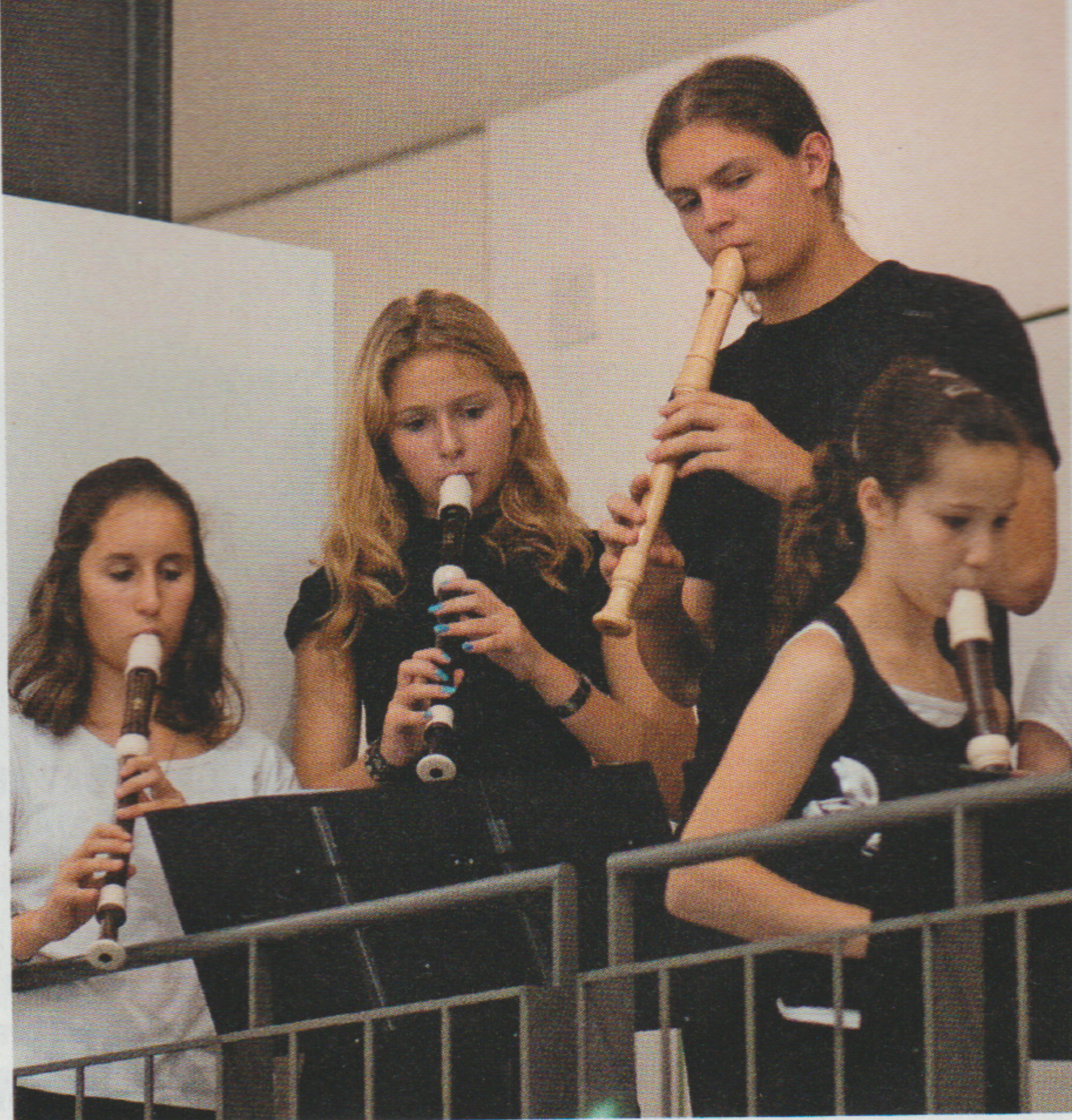
Onze jours pour découvrir les plaisirs de la flûte à bec.